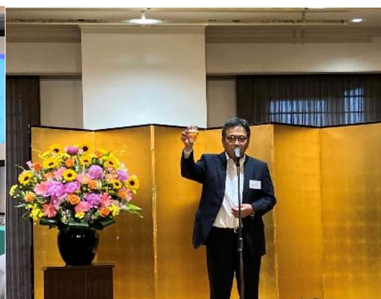
高岡副会長 乾杯ご挨拶