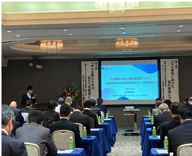
経済産業省および中小機構による省エネセミナー